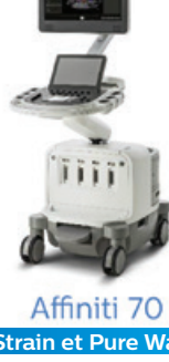
Affiniti 70 Strain et Pure Wave