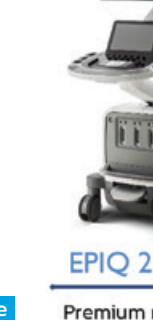
EPIQ 2D 3D Premium nSIGHT