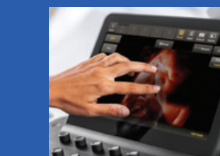
CONSEILS - ACTUALITÉS