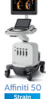
Affiniti 50 Strain